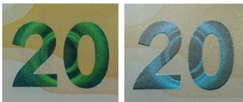
图 8 光彩光变图案防伪效果示意图

位于票面正面右侧。改变观察角度，面额数字“20”的颜色在绿色和蓝色之间变化，并可见圆形光环效果。防伪特征效果见图 8。