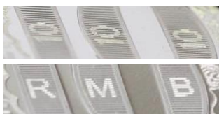
图 3 隐形图文效果示意图