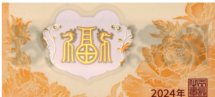
图 7 透明视窗防伪效果示意图