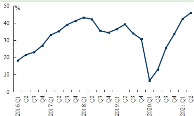
图1：银行家宏观经济热度指数

银行家宏观经济热度指数为45.9%，比上季上升3.5个百分点。其中，有79.3%的银行家认为当前宏观经济“正常”，比上季增加7.8个百分点；有14.5%的银行家认为“偏冷”，比上季减少7.4个百分点。对下季度，银行家宏观经济热度预期指数为48.4%，高于本季2.5个百分点。