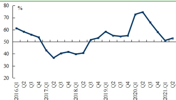
图 4: 货币政策感受指数

货币政策感受指数为 52.9%，比上季提高 1.9 个百分点，比上年同期降低 21.7 个百分点。其中，有 11.6% 的银行家认为货币政策“宽松”，比上季减少 2.5 个百分点；82.6% 的银行家认为货币政策“适度”，比上季增加 8.8 个百分点。对下季，货币政策感受预期指数为 51.5%，低于本季 1.4 个百分点。